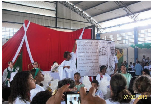
Missa em homenagem à Dra. Zilda.