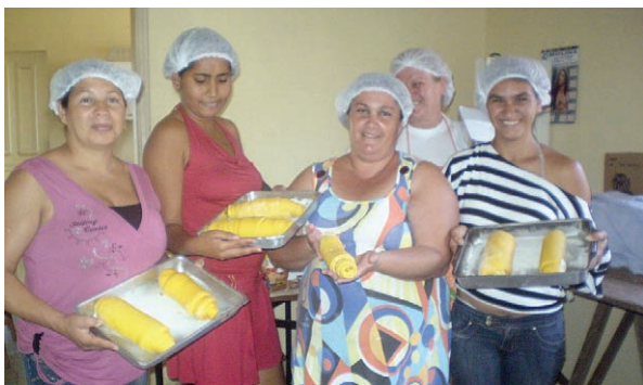
Mães aprendem sobre alimentação saudável.

Nos reunimos em uma casa da paróquia com o apoio do nosso pároco, Padre Ângelo. Passamos a tarde com as mães, conversamos, rezamos e partimos para a prática. Foi um dia de partilha muito gratificante para todos.