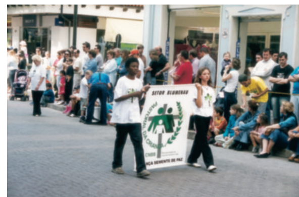
Pastoral da Criança: presença marcante nas comunidades.

Participação da Pastoral da Criança em desfile comemorativo pelo aniversário de fundação do município.