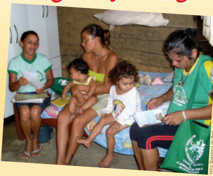
Setor Bragança do Pará

A Pastoral da Criança tem como foco do seu trabalho as crianças, mas os cuidados com as famílias e comunidades não podem faltar. É como dizia a Dra. Zilda Arns Neumann: "se as famílias vão bem, a criança vai bem".