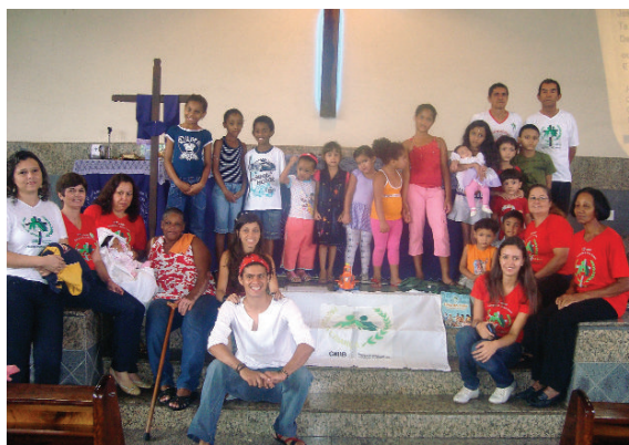
Missa comemorativa pelo aniversário da Pastoral da Criança.