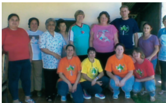
Líderes participam de capacitação para brinquedistas.