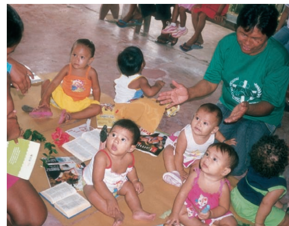
Crianças acompanhadas pelo Setor Parintins.