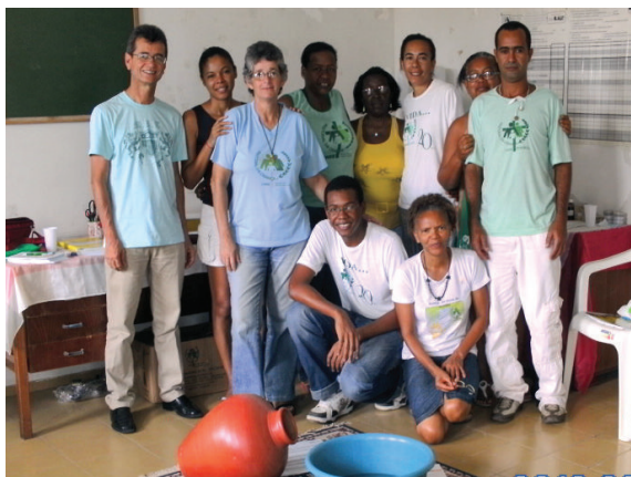
Pastoral da Criança: Trabalho em equipe para salvar vidas.

A equipe se reuniu no dia 6 de março, cheia de entusiasmo e de projetos que já estão sendo colocados em prática, como a construção da cozinha da Casa da Pastoral da Criança; o resgate de líderes; e a